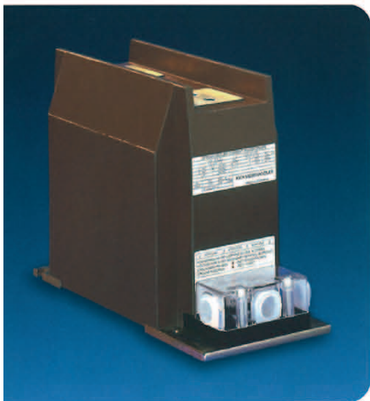
Sonderbauform mit verlängerten Kriechstrecken special design for enlarged creepage distances